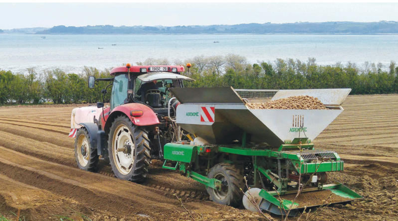
> Plantation des semis à Carantec (29)

Leur expérience et l'expertise de Germicopa permettent de tirer le meilleur des 3 650 hectares de plants de pommes de terre mis en production chaque année.