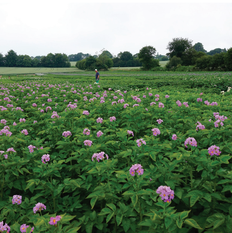
> Champ d'essais en fleurs - Châteauneuf-du-Faou (29)

Germicopa est reconnue dans le monde entier pour la grande qualité des produits et des services qu'elle fournit, de la production et la logistique à l'accompagnement technique et promotionnel. Son action à tous les niveaux de la filière fait l'identité de Germicopa.