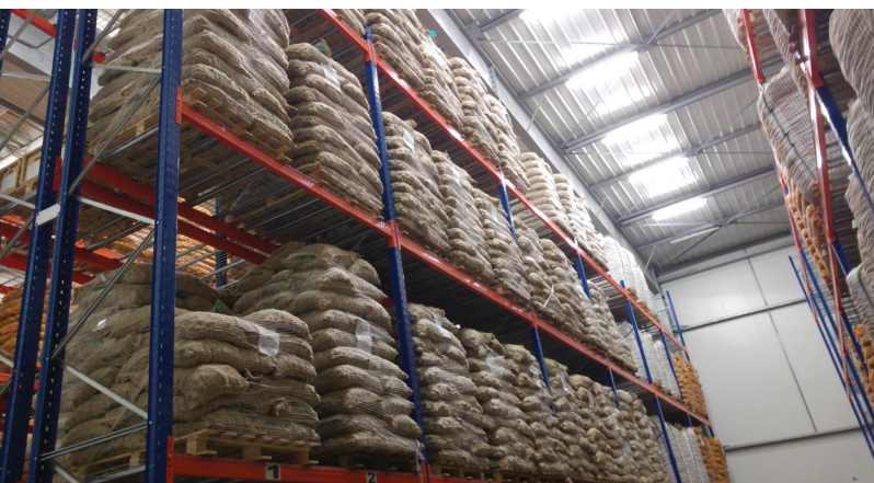
> Stockage au centre de Landivisiau (29)

au choix et au suivi des partenaires logistique, qu'il s'agisse de transport terrestre ou maritime. Ce savoir-faire est une des clés du succès de Germicopa, en France comme à l'export.