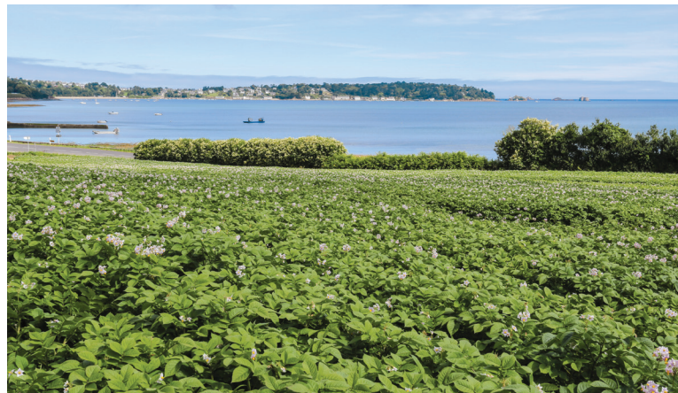
> Champs de sélection de pommes de terre à Carantec (29)