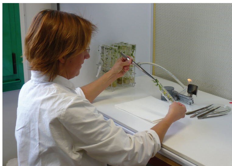
> Laboratoire de la station de recherche