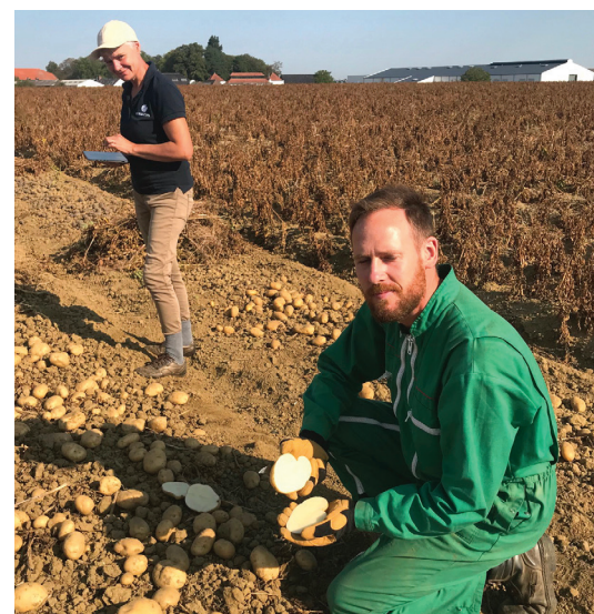
> Champs d'essais à Cappelle-en-Pévèle (59) au siège du Groupe Florimond Desprez