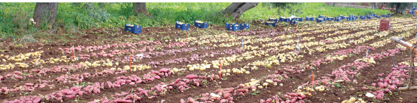
> Récolte d'un champ d'essais

Les variétés à succès de demain sont identifiées grâce à l'analyse des dizaines de milliers de données recueillies : rendements, qualités de présentation et d'utilisation, résistances aux différents stress biotiques et abiotiques, ainsi qu'aptitude à la production de plant.