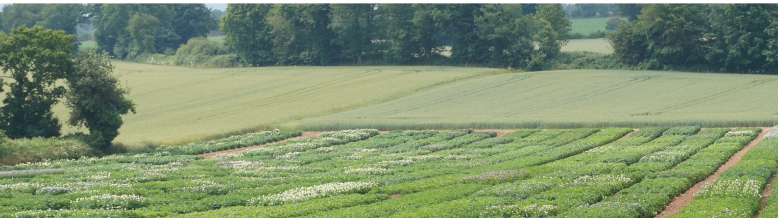
> Champ d'essais en fleurs - Châteauneuf-du-Faou (29)

Germicopa les accompagne également dans la mise en valeur de ses variétés auprès des consommateurs.