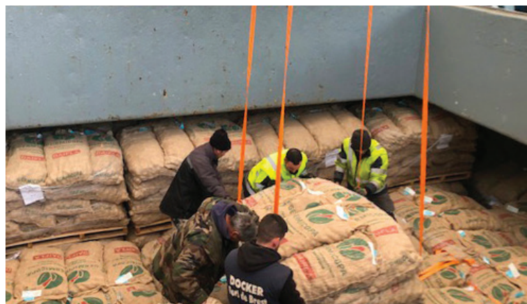
> Mise en cale pour une livraison par bateau - départ de Brest (29)