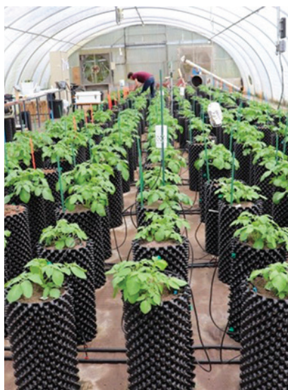
> Essai de sensibilité au stress hydrique