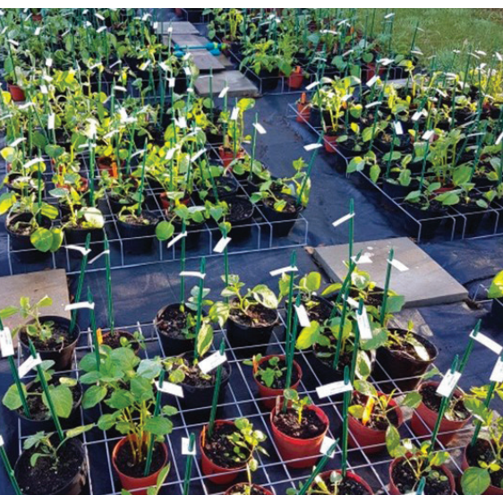
> Multiplication de graines issues de croisement avec des espèces apparentées